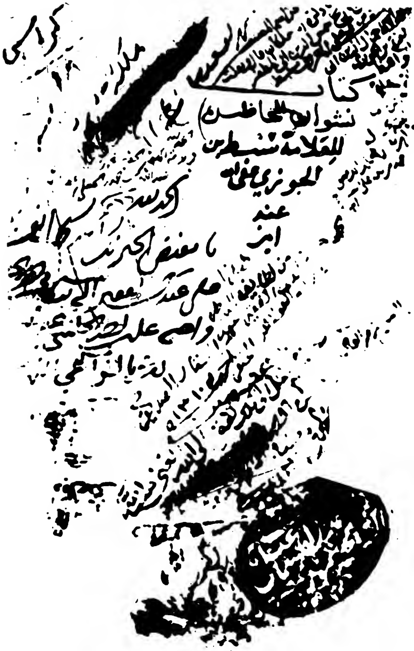
واجهة كتاب نشوار المحاضرة لسبط ابن الجوزي